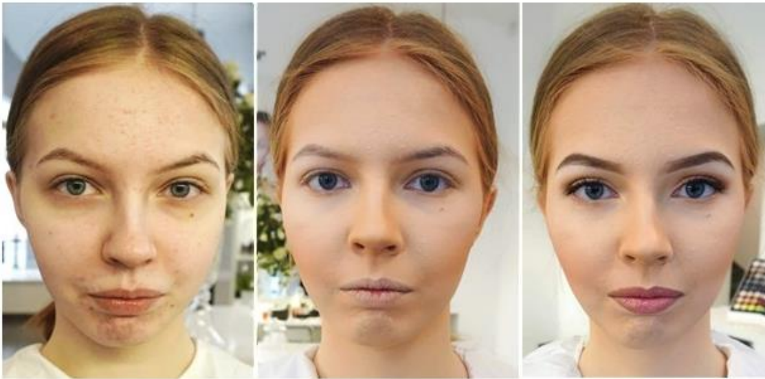
2 pav. Tiriamoji E. Tyrimo rezultatai prieš, eigoje, po korekcijos makiažu, 16-20 metų amžiaus grupė