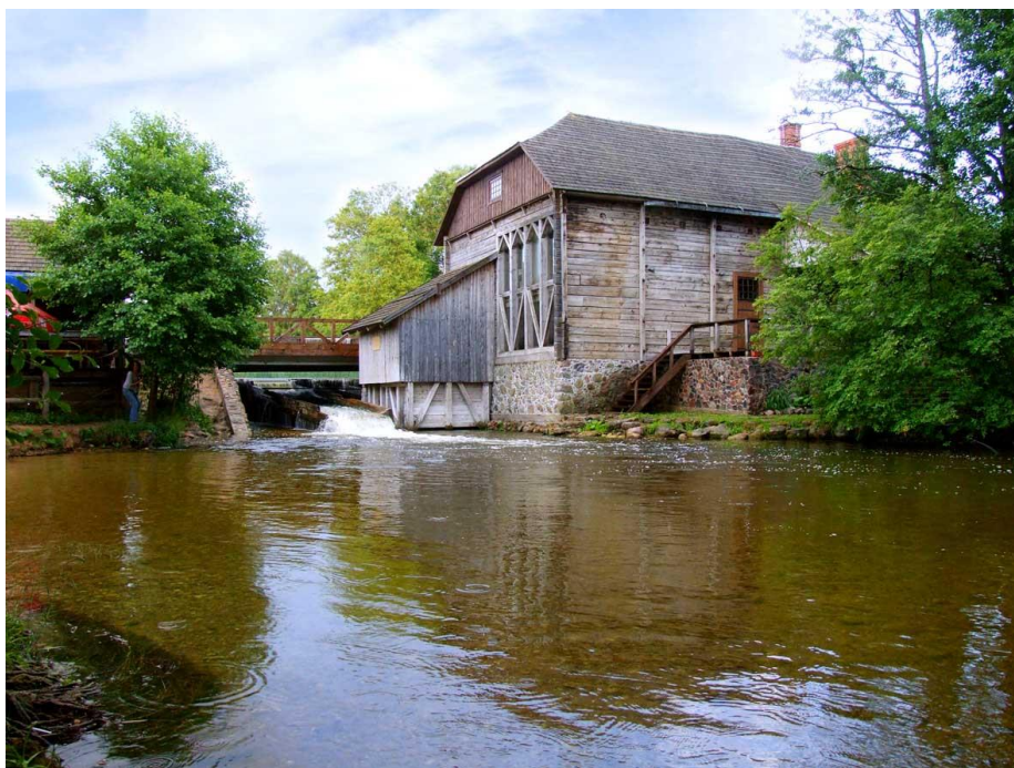
3 pav. Ginučių vandens malūnas

( https://www.google.lt/search?q=kaimo+turizmas&espv=2&biw=1600&bih=775&source=lnms&tbm=isch&sa=X&ved=0ahUKEwilvY-6sd7MAhWLE5oKHTNbAIAQ_AUIBigB#tbm=isch&tbs=ring%3ACW )